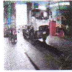
Left